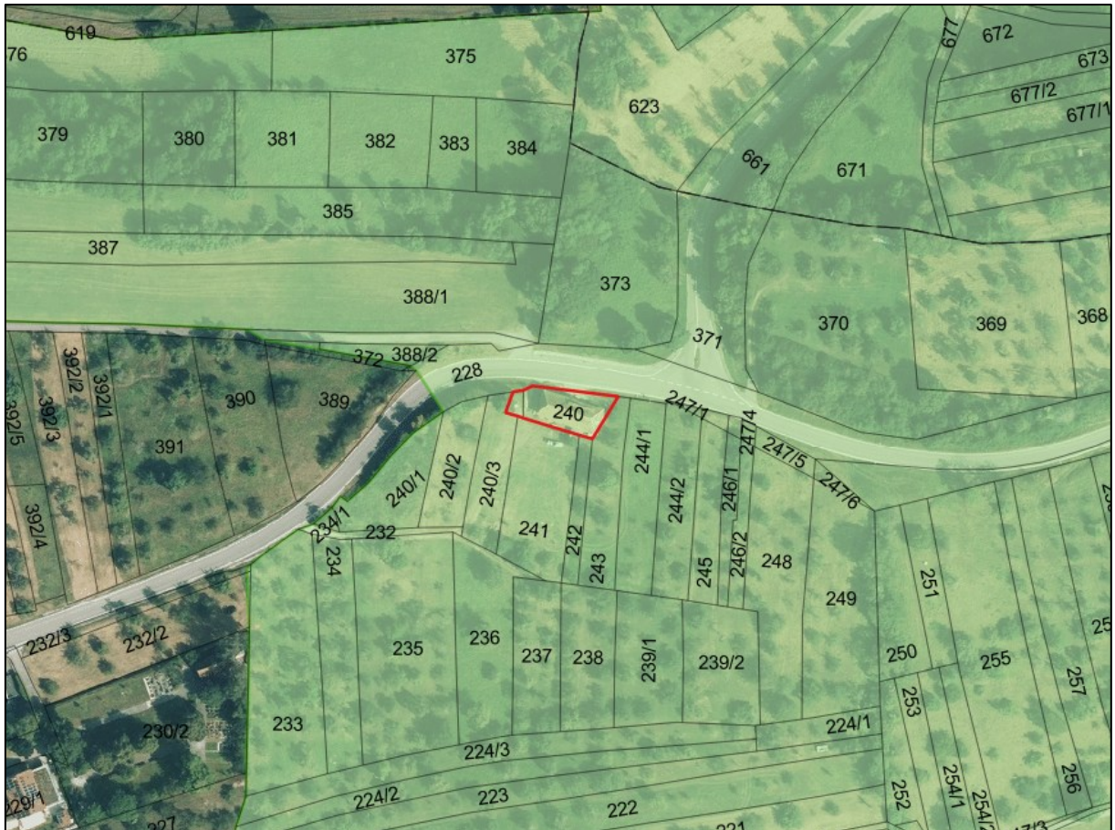
Abb. 5: Ausschnitt aus dem LSG „Südliches Weissacher Tal und Berglen“ mit Überschneidungsbereich des Plangebiets (rote Fläche) mit dem LSG; ohne Maßstab; Kartengrundlage: Räumliches Informations- und Planungssystem (RIPS) der LUBW, Amtliche Geobasisdaten © LGL, www.lgl-bw.de, Az.: 2851.9-1/19

Das 380 m 2 große Plangebiet liegt im Rems-Murr-Kreis, östlich des Ortsteils Bruch in der Gemeinde Weissach im Tal und umfasst das Flst.-Nr. 240 sowie Teile des Flst.-Nr. 240/3 der Gemarkung Bruch. Das gesamte Plangebiet befindet sich in der Großlandschaft Neckar- und Tauber Gäuplatten im Naturraum Neckarbecken, welcher durch ein mildes Klima sowie i.d.R. intensive ackerbauliche Nutzung geprägt ist. Das Plangebiet liegt mit einer Fläche von 380 m 2 (0,038 ha) im LSG „Südliches Weissacher Tal und Berglen“, für das eine Entnahme aus dem LSG beantragt wird (Abb. 5).