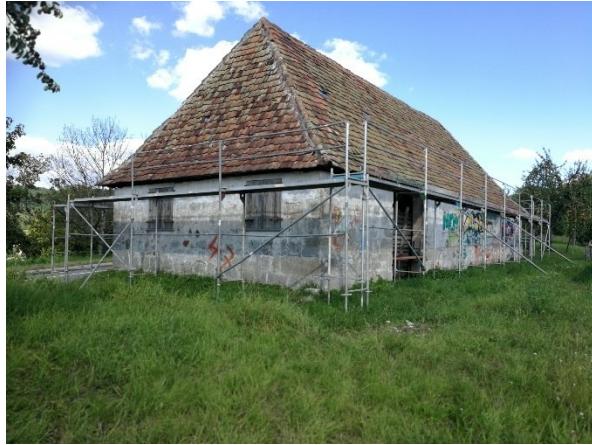
Abb. 6: Alte Kelter, Blick von Südwesten, im Vordergrund Fettwiese