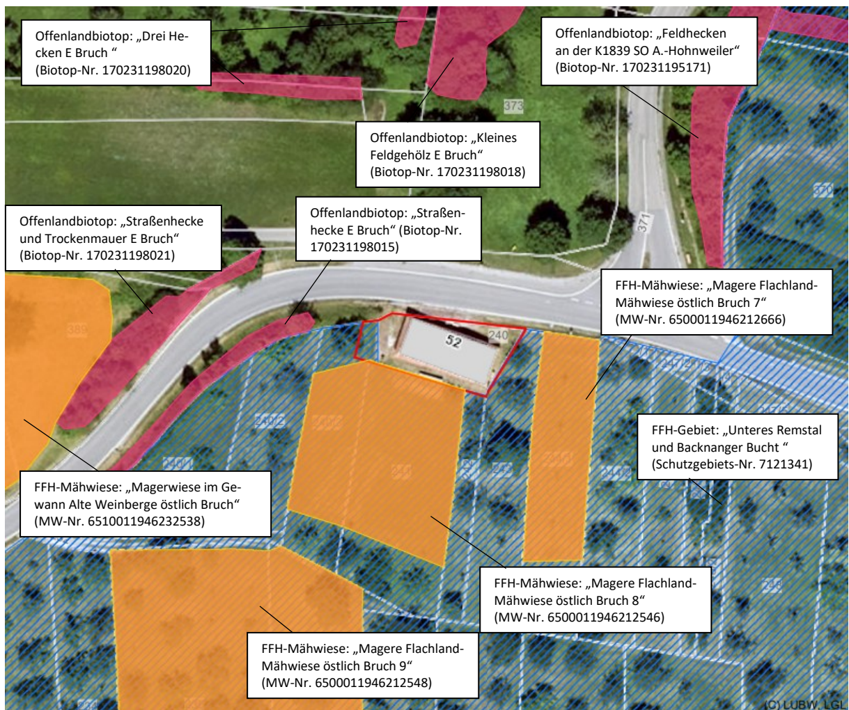
Abb.4: Lage des Plangebiets (rote Markierung) mit Schutzgebieten (blau = FFH-Gebiet, orange = FFH-Mähwiese, magenta = geschütztes Biotop) im näheren Umfeld, ohne Maßstab; Kartengrundlage: Räumliches Informations- und Planungssystem (RIPS) der LUBW, Amtliche Geobasisdaten © LGL, www.lgl-bw.de, Az.: 2851.9-1/19

Das Plangebiet befindet sich vollständig im LSG „Südliches Weissacher Tal und Berglen“ (Schutzgebiets-Nr. 1.19.060) und vollständig im Naturpark „Schwäbisch- Fränkischer Wald“ (Schutzgebiets-Nr. 5). Zudem liegt der westliche Teil des Plangebiets im FFH-Gebiet Unteres Remstal und Backnanger Bucht (Schutzgebiets-Nr. 7121341). Im nahen Umfeld liegen außerdem vier FFH-Mähwiesen, „Magerwiese im Gewann Alte Weinberge östlich Bruch“ (MW-Nr. 6510011946232538) und FFH-Mähwiese: „Magere Flachland-Mähwiese östlich Bruch 7, 8, 9“ (MW-Nr. 6500011946212666, 6500011946212546, 6500011946212548) sowie mehrere nach § 30 BNatSchG als Offenlandbiotop geschützte Gehölzstrukturen. Hierzu gehören (von Westen nach Osten) die Biotope „Straßenhecke und Trockenmauer E Bruch“ (Biotop-Nr. 170231198021), Straßenhecke E Bruch“ (Biotop-Nr. 170231198015), „Drei Hecken E Bruch“ (Biotop-Nr. 170231198020), „Kleines Feldgehölz E Bruch“ (Biotop-Nr. 170231198018) und „Feldhecken an der K1839 SO A.-Hohnweiler“ (Biotop-Nr. 170231195171). Das Plangebiet liegt als ausgewiesene Kernfläche innerhalb des Biotopverbunds mittlerer Standorte. Zudem befindet es sich im ausgewiesenen Suchraum 1.000 m des Biotopverbunds trockener Standorte. Ein kleiner nordöstlicher Bereich des Plangebiets ist als Suchraum 1.000 m des Biotopverbunds feuchter Standorte ausgewiesen.