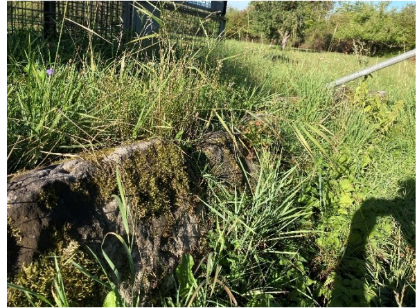
Abb. 7: Abb. 9: Südliche Trockenmauer, im Hintergrund Streuobstwiesen

Das Plangebiet liegt innerhalb der geologischen Einheit der Grabfeld-Formation (Gipskeuper). Die natürlichen Bodenpotenziale sind im Untersuchungsgebiet bereits durch das Gebäude „Alte Kelter“ und die damit einhergehende Versiegelung gestört. Die Funktionen „Filter und Puffer für Schadstoffe, Infiltration in das Grundwasser, Standort für seltene Vegetation und Standort für die landwirtschaftliche Produktion“ können daher nur geringfügig erfüllt werden. Die Leistungsfähigkeit und die Empfindlichkeit sind „gering“ ausgeprägt.