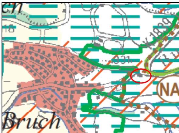
Abb.2: Ausschnitt der Raumnutzungskarte des Regionalplan Verband Region Stuttgart mit Lage von Bruch und Plangebiet (rote Markierung), ohne Maßstab

Nach geltendem Flächennutzungsplan der vereinbarten Verwaltungsgemeinschaft Backnang, rechtskräftig seit dem 14.12.2006 ist das Plangebiet als Fläche für Landwirtschaft dargestellt. Im Norden verläuft eine Straße, welche als örtlicher Hauptverkehrszug dargestellt ist (Abb.3).