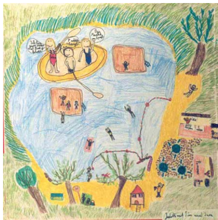
Erholungsmöglichkeiten der Gemeinde Riedstadt aus Kinderperspektive.

Maßnahmen und ein Handlungsprogramm erarbeitet. Mit Hilfe von Indikatoren werden die Fortschritte der nachhaltigen Gemeindeentwicklung regelmäßig überprüft. Seit April 2001 gibt es einen Perspektivenausschuss. Dieser arbeitet unabhängig vom Tagesgeschäft der Gemeindevertretung und befasst sich mit den langfristigen Planungen der Gemeinde.