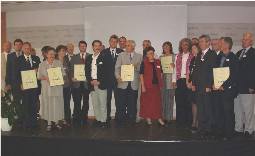
Vertreter von ausgezeichneten Kommunen bei der Preisverleihung Zukunftsfähige Kommune 2004.